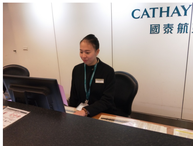
團體旅客報到櫃台