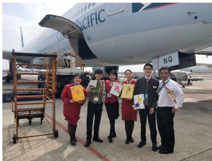
紀念福岡線最後一次飛航