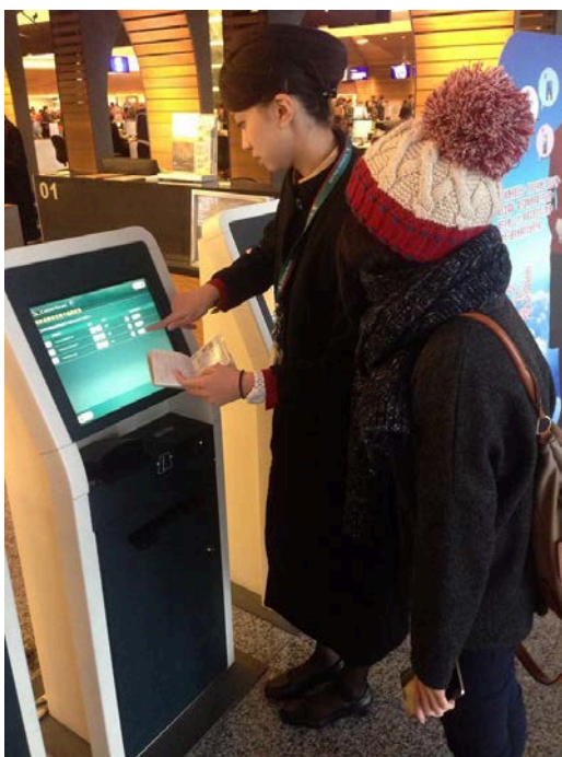
◎協助客人使用自助劃位機器