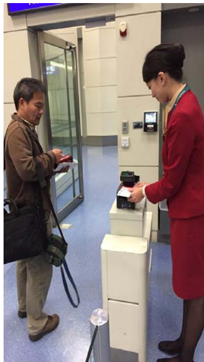
◎讀取登機證時必須要面帶微笑並問候客人