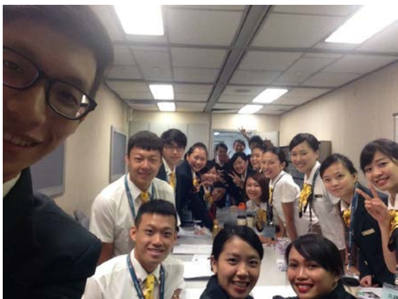
◎剛進入公司的大家，上課中