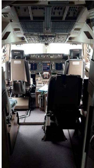
◎兩張照片為參觀飛機照頭等艙和駕駛艙