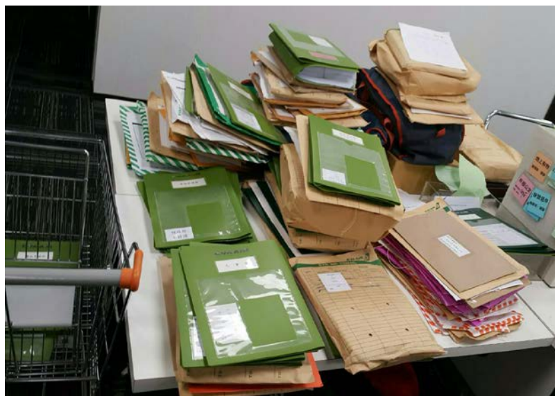
※每日財務部公文收發