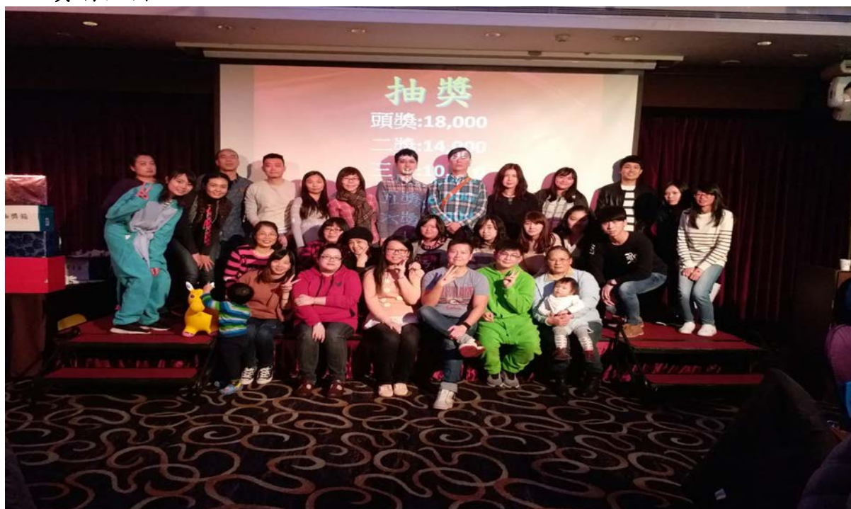
擔任尾牙主持人與大家合照留影