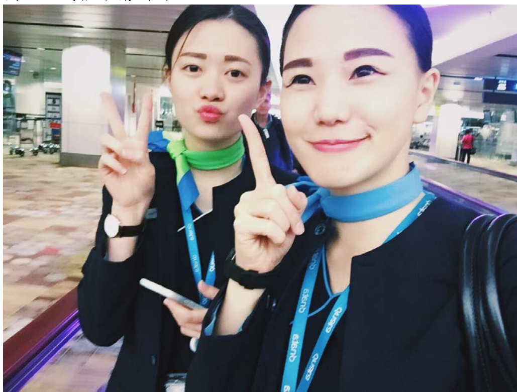
圖五、最喜歡和絹芷一起上班