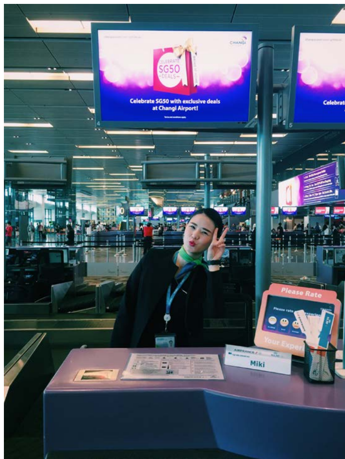
圖一、剛開始自己在櫃檯獨當一面