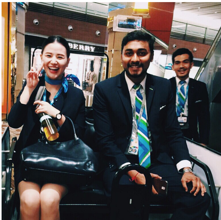
圖六、和主管一起從遙遠的 T3 回 T1 有 buggy 接送很開心