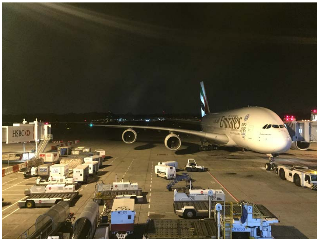
圖九、常常被派去做星好家的 emirates A380