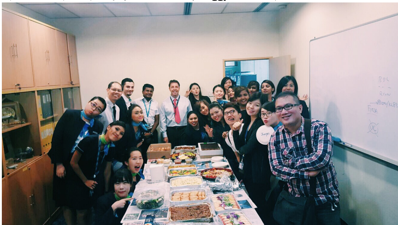
圖七、Airfrance&KLM 的聖誕節交換禮物 party