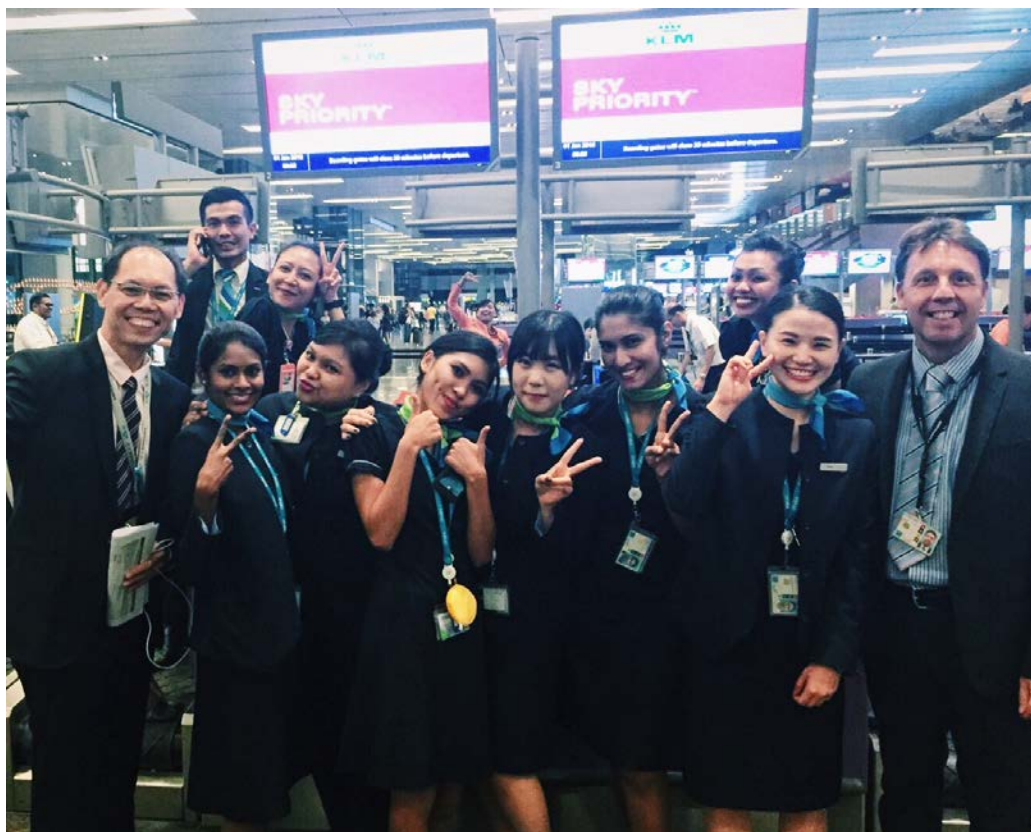
圖八、大家一起在櫃檯倒數跨年