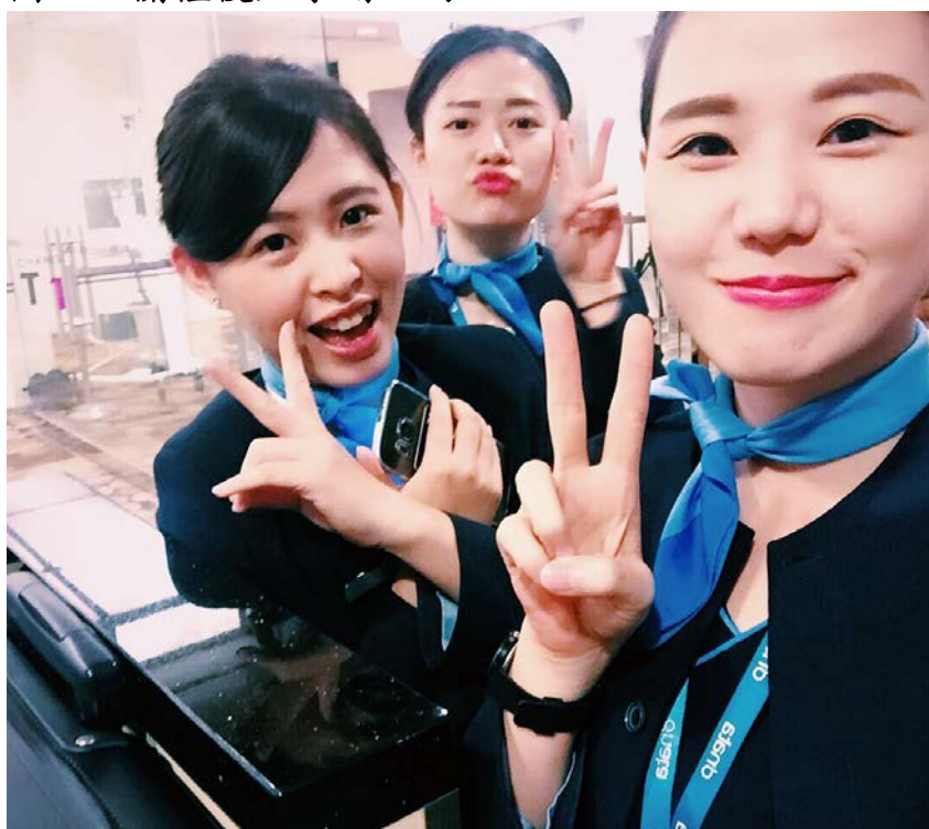
圖三、很難得跟我的 mentor 做同一班飛機