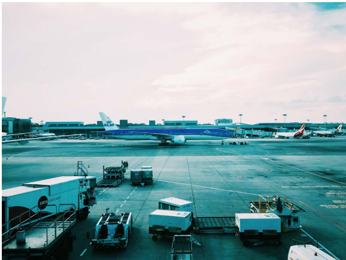
圖十一、目送自家飛機