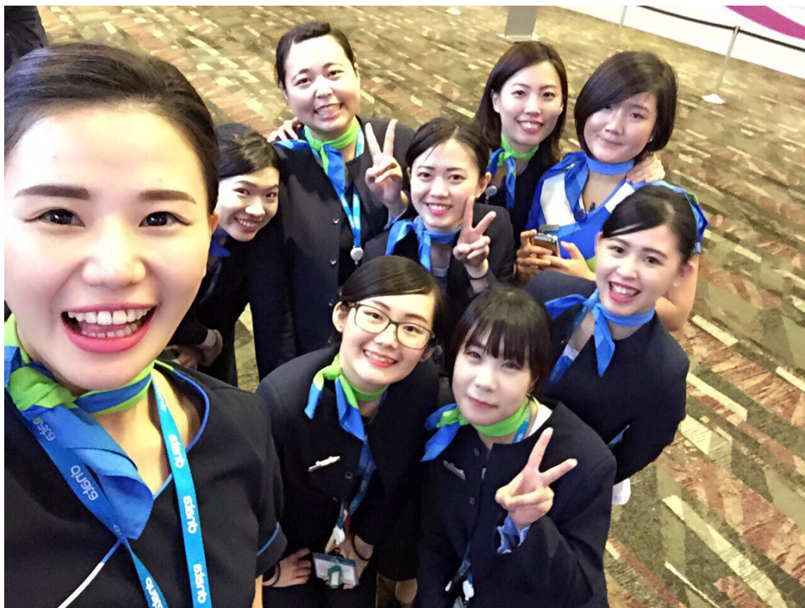
圖二、關櫃後大家開心的 selfie