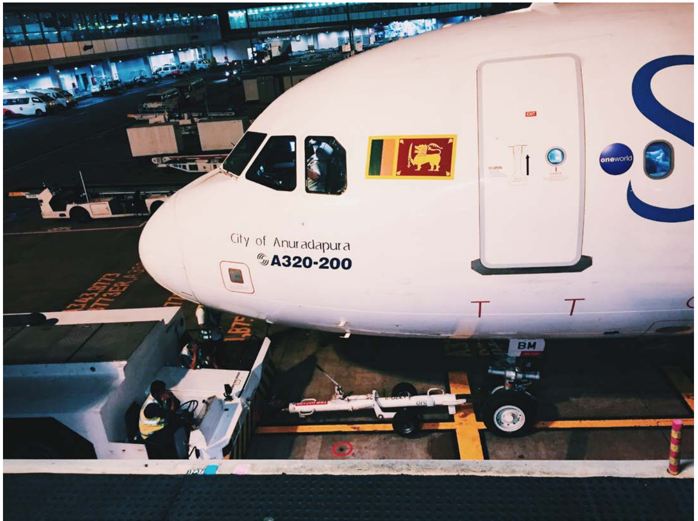
圖十、等待 SriLankan airline push